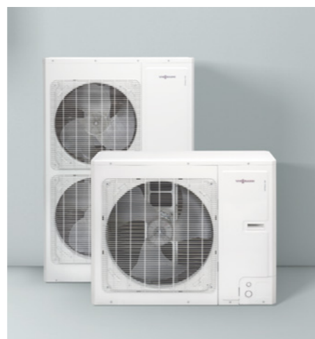
Наружные блоки насоса Vitocal 100-S

С дополнительным интернет-интерфейсом Vitosconnect тепловые насосы воздух/вода Vitocal 100-S / 111-S находятся в режиме онлайн. С помощью бесплатного приложения ViCare можно легко управлять со смартфона многими функциями, такими как регулирование температуры или «режим вечеринки».