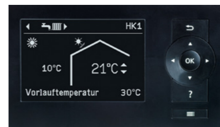
Контроллер теплового насоса Vitotronic 200