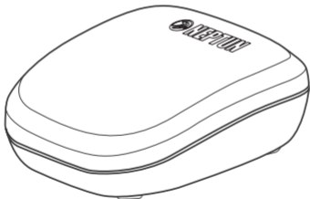
Рис. 1. Внешний вид радиодатчика