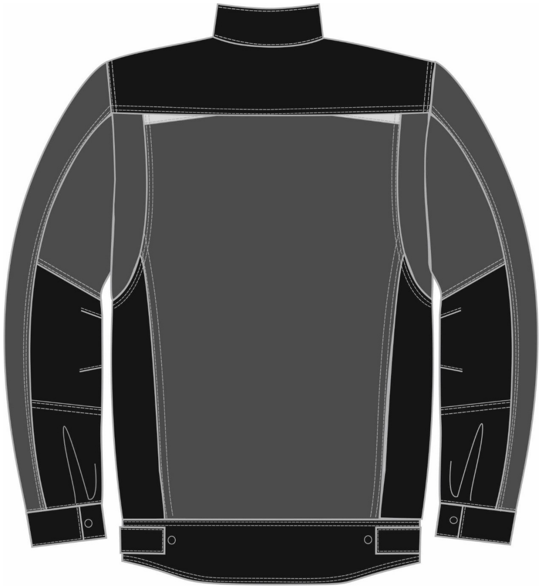
Рис.2.Эскиз Костюм Милан (тк.Карелия,260) брюки, серый/черный, куртка, вид сзади.