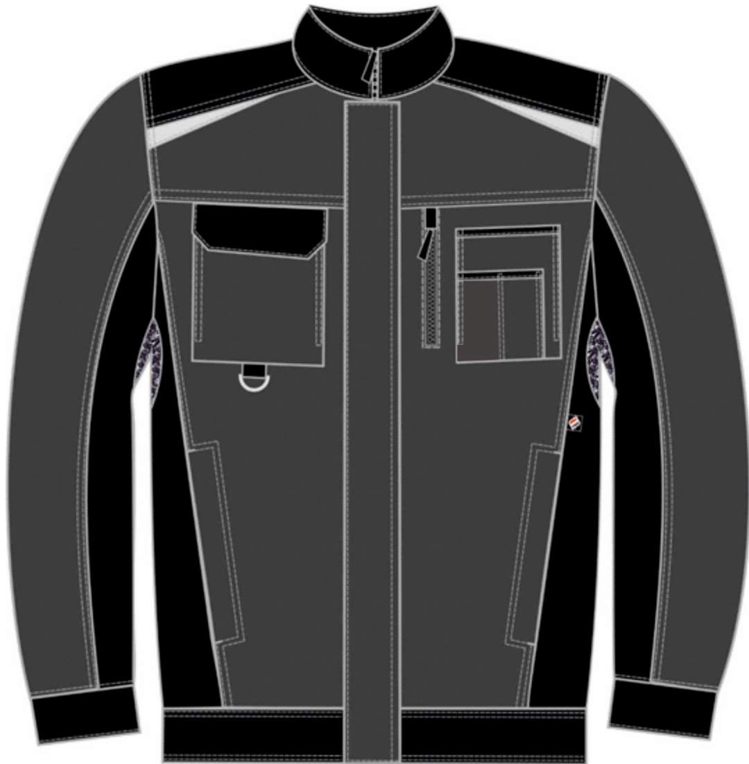
Рис.1.Эскиз Костюм Милан (тк.Карелия,260) брюки, серый/черный, куртка, вид спереди.