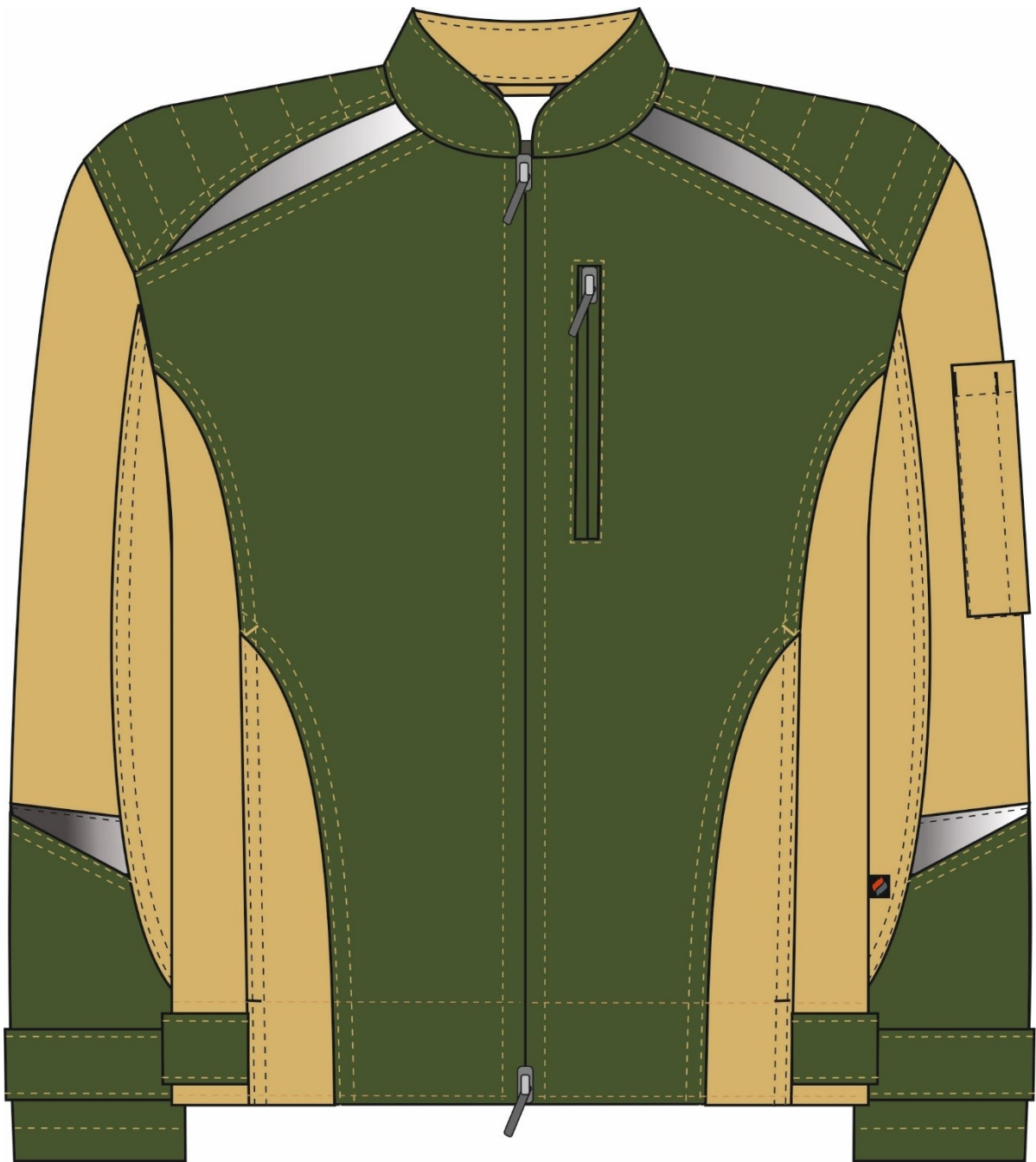
Рис.1.Эскиз Костюм Челси (тк.Канвас,270) брюки, хаки/бежевый, куртка, вид спереди