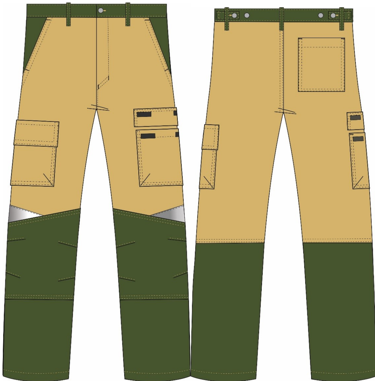
Рис.3.Эскиз Костюм Челси (тк.Канвас,270) брюки, хаки/бежевый, вид спереди и сзади.