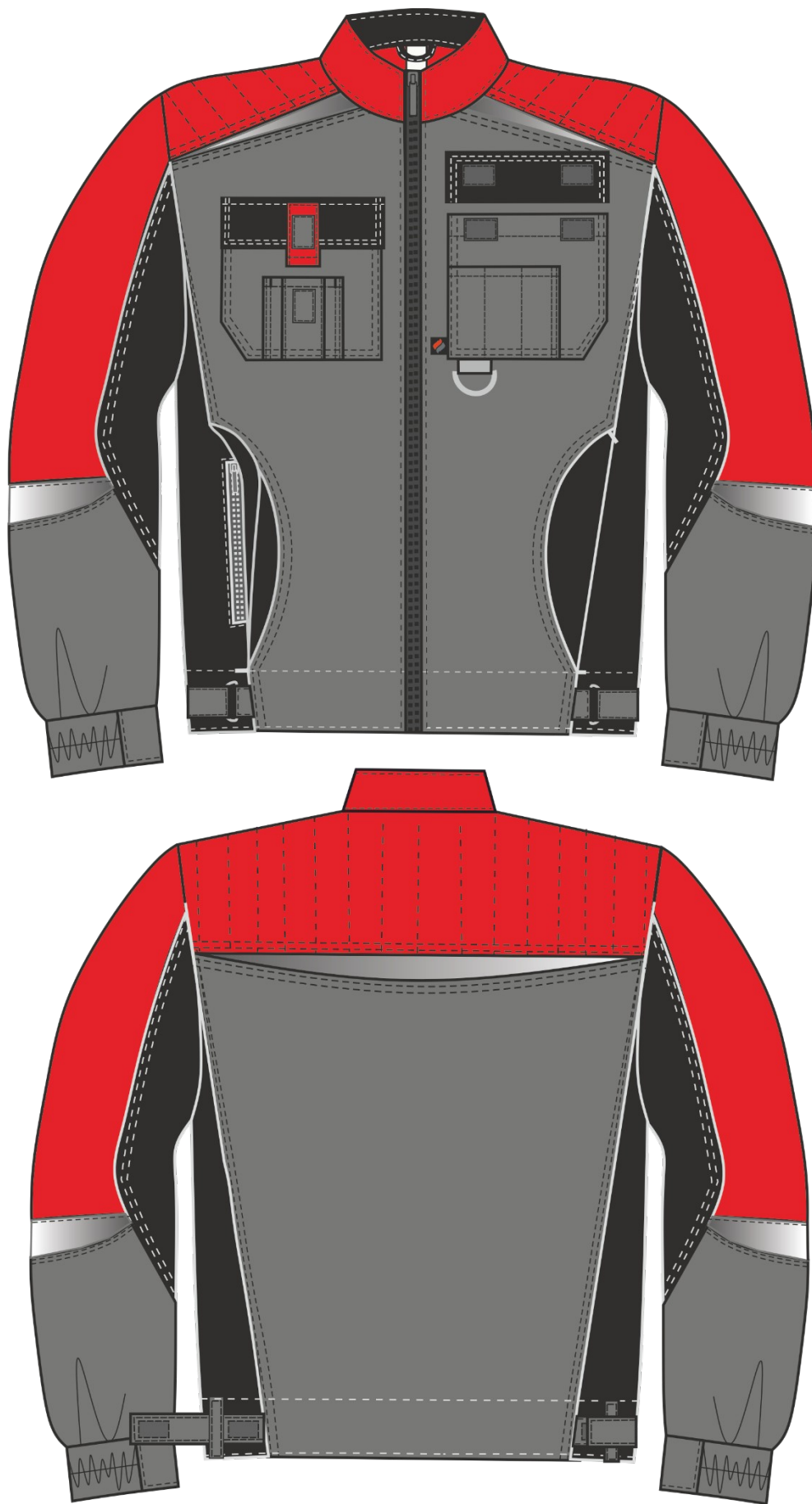
Рис.1. Эскиз Костюм Формула (тк.Смесовая,240) брюки, серый/красный/черный. Куртка, вид спереди и сзади.